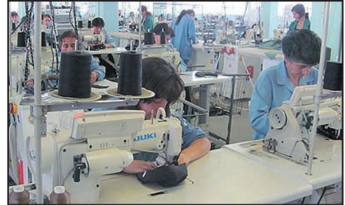
მომზადების (გადამზადების) კურსები კონსულტაციის და დასაქმების ცენტრის ბენეფიციართათვის