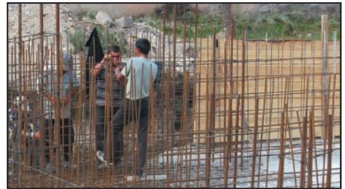
კონსულტაციის და დასაქმების ცენტრის ბენეფიციარები ახალქალაქში საცურაო აუზს აშენებენ