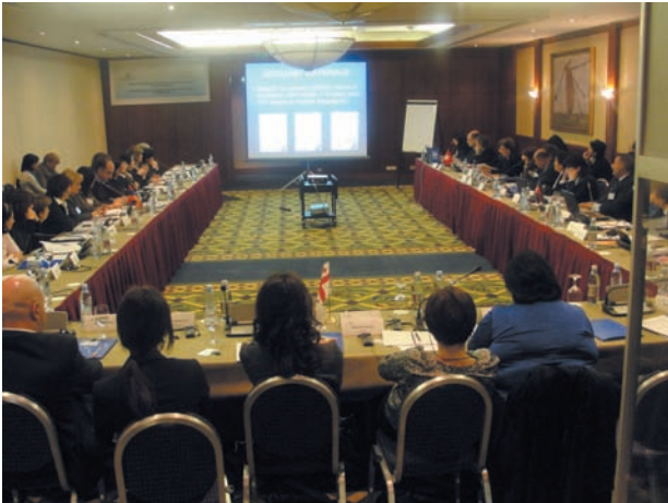
რეგიონული კონფერენცია, რომელსაც IOM-მა თბილისში 2010 წლის 2 და 3 დეკემბერს უმასპინძლა

პროექტის მეორე ეტაპზე ტრენინგი ჩატარდა სკოლის მასწავლებლებს ახალი მასალის სრულყოფილად ათვისებასა და შემდგომ მოსწავლეთათვის გადაცემაში შესაბამისი მეთოდოლოგიის მიხედვით. მთლიანად, ტრენინგი ჩატარდა 3,600-ზე მეტ მასწავლებელს სამივე ქვეყანაში, რაც ტრენინგის წინააღმდეგ მიმართული საგანმანათლებლო მასალის სასკოლო პროგრამაში ჩართვის ერთ-ერთი მნიშვნელოვანი არგუმენტი უნდა გახდეს.